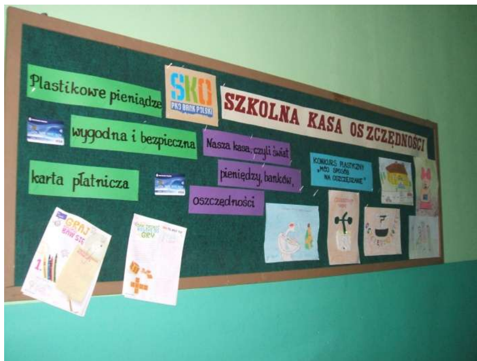
Ryc. Gazetka Szkolnej Kasy Oszczędnościowej

SKO przy Szkole Podstawowej w Grywałdzie działa i liczy obecnie 37 członków, którzy systematycznie oszczędzają swoje pieniądze. Do SKO należą, także całe klasy (kl. V, kl. VI ) wpłacając zaoszczędzone pieniądze na wycieczkę klasową, która odbędzie się późną wiosną 2011 roku.